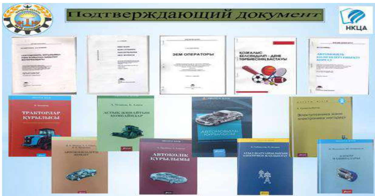
Кітапхана кітап қоры

Ал колледжде 2022 жылғы 01 қарашаға «Білім алушылар контингентіне қатысты оқу жұмыс жоспарына сәйкес, оның ішінде мамандықтың даярланатын біліктіліктері бойынша толық оқу кезеңіне оқу тілдері бойынша оқу және ғылыми әдебиеттің кітапханалық қорының болуы: